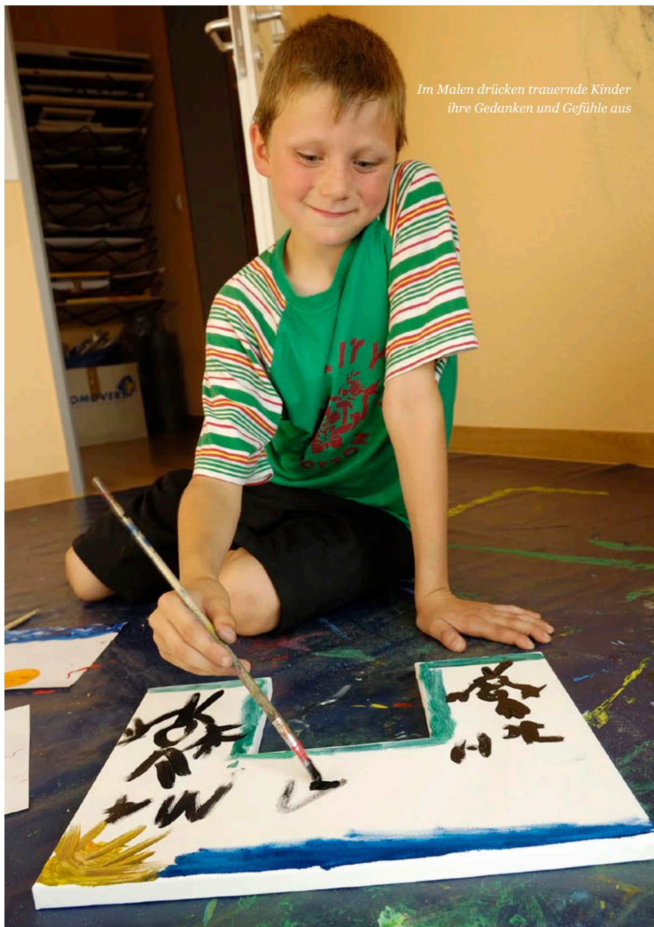
Im Malen drücken trauernde Kinder ihre Gedanken und Gefühle aus